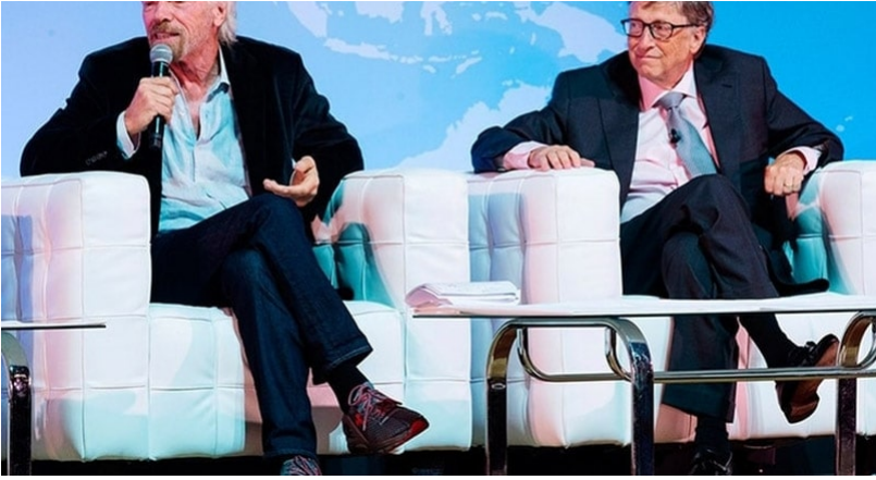
Ο Bill Gates και ο Richard Branson συζητούν για το Big Money Rush στο CES 2019

Αυτές οι τεχνολογικές ιδιοφυΐες έχουν χτίσει πολλές εταιρείες δισεκατομμυρίων που σχετίζονται με την επίλυση σύνθετων ζητημάτων, όπως οι ηλεκτρονικές πληρωμές, η πληροφορική και οι μεταφορές. Τώρα ασχολούνται με το παγκόσμιο πρόβλημα της ανισότητας του πλούτου, επιτρέποντας στον οποιονδήποτε - ανεξάρτητα από το πόσο πλούσιος ή φτωχός είναι - να βγάλει αρκετά χρήματα, ώστε να απολαύσει μια ευτυχισμένη και ικανοποιητική ζωή.